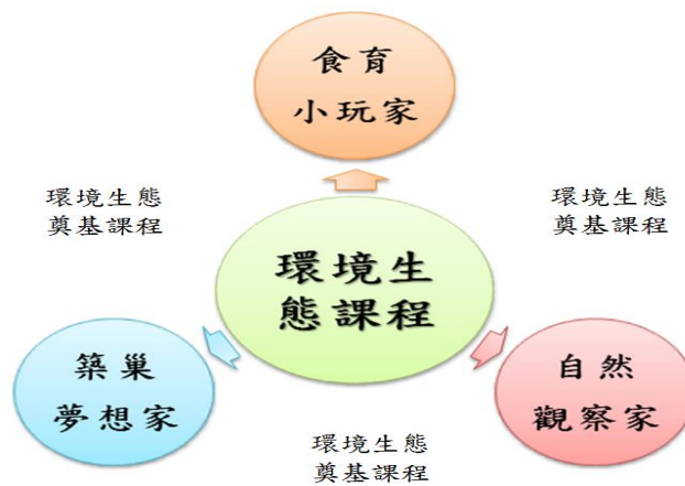
環境生態課程架構圖

「美創博嘉」素養為本校課程的重要價值，「環境生態課程」係將現有自然科領域注入「美感力、創造力、思考力、行動力」內涵所重新建構的課程(如下圖)，著重於知識學習轉化為生活實作的應用與反思，從孩子的生活經驗出發，將課堂所學的知識與生活情境互為印證，從愛自己、愛他人進而能理解環境、關懷環境進而實踐改善環境。除「環境生態奠基課程」外，另發展出三大學習主題，部分課堂以協同合作進行教學，學生藉由小組合作及團隊實踐學習任務，培養覺知問題的敏銳度與問題解決的能力，透過「美感學習-創意激發-反思修正-轉化行動」的學習歷程，落實環境生態課程學習的意義。